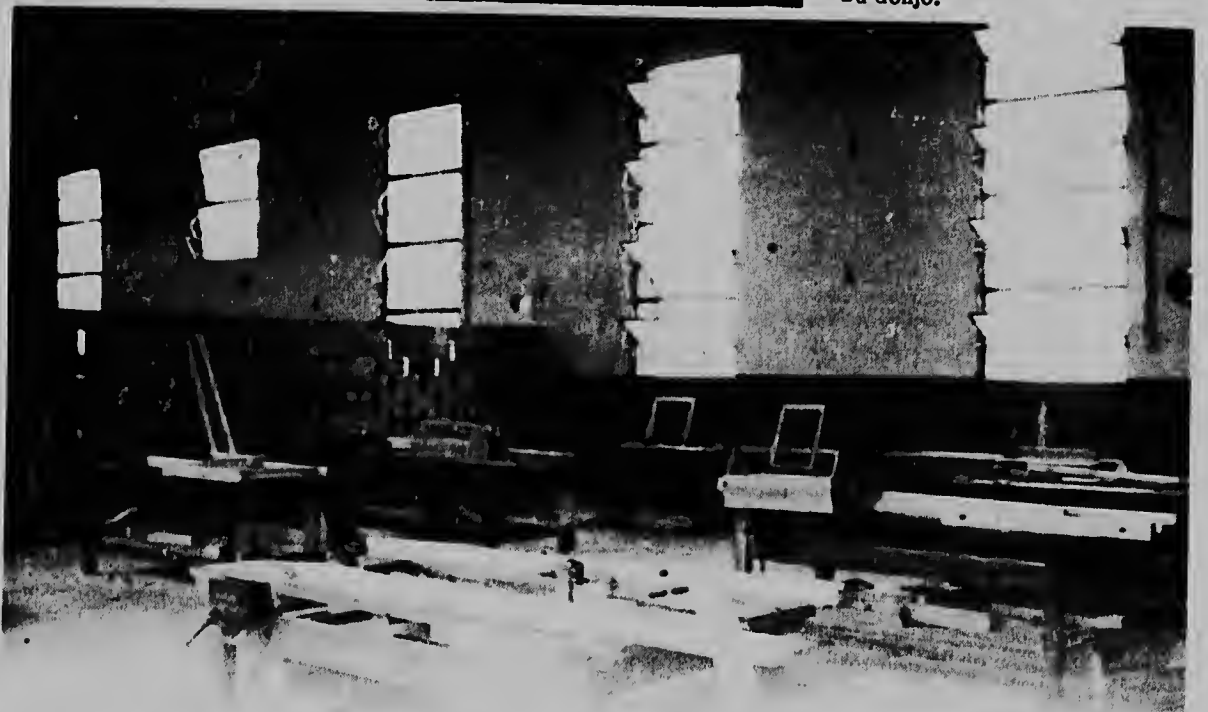
Pleistermentu di muraya tambe ta forma un parti di e lesnan practica cu e trahadornan di werkverschaffing ta hanja den e anterior edificio di Eagle.

ORANJESTAD - Mencion a ser haci cu un net a desaparece. E donjo di e net aki a presenta na warda di polis mas laat pa informa cu e net a aparece. Ta resulta cu un amigu a warda e net p'e pa hendenan cu dede largo no bai cu ne. No tabata su intencion ningun momento so di horta e net. Bueno e net awor ta den poder di su donjo.